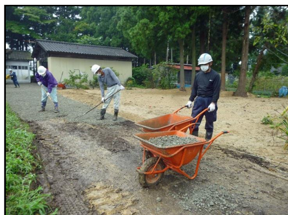
住宅除染実施状況