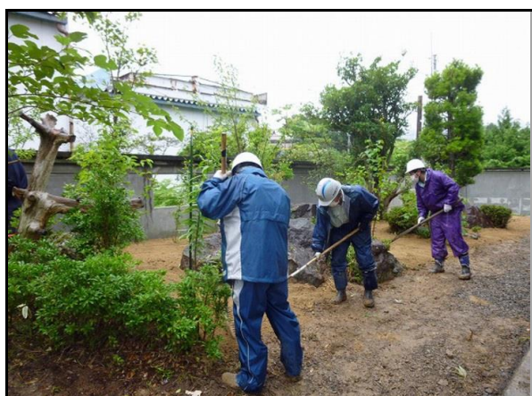
住宅除染実施状況