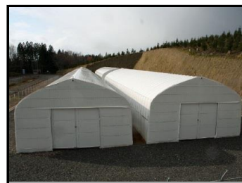
仮置場（裏側から撮影）