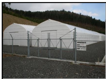
仮置場（入り口側から撮影）