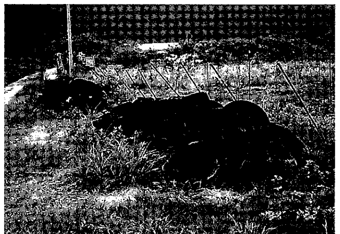
野積みされた古タイヤ

しかし、その後「まゆの価格の低迷やぶどうの病気の発生」により、栽培面積の減少や、離農等により耕作放棄地が拡大し、更に環境汚染につながるということで燃やすことができず、古タイヤの野積み のり積み が更に古タイヤの不法投棄を招き、ついには2万本のタイヤが放置される状態となりました。