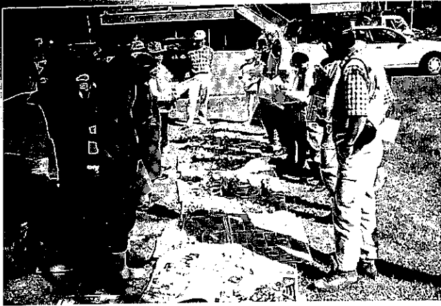
「採取されたきのこの鑑定会風景」(只見町)