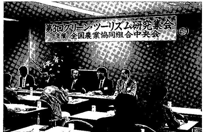
研究集會での全体討議

最後には、少ない時間ながら全体の討論会がもたれて、活発な意見交換が行われました。