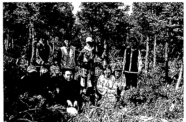
参加した先生たち