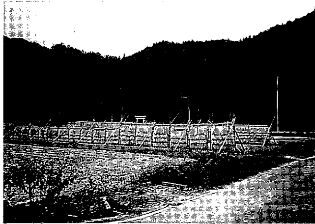
「はで」、歳 いずみ の神に使用するワラの確保と昔ながらの稲作風景の保存