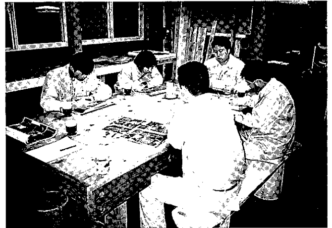
真剣に講義を受ける研修生

というテーマで、機械化された木材生産状況に関する講義を受けました。研修生たちは、日本の森林とスケールが違うことに驚き、外材との競争が激化する中で日本の林業の厳しい前途に気を引き締めていました。