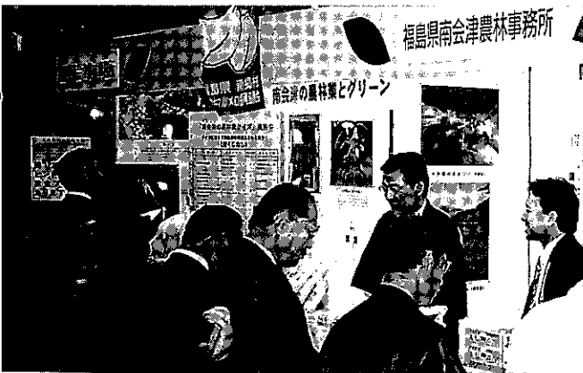
クイズで南会津をPR

なお、クイズの回答者900名の中から、全問正解した453名のうち厳正な抽選のうえ、須賀川市在住の女性ほか2名の方に南会津の銘酒4銘柄セットを先日送付しました。