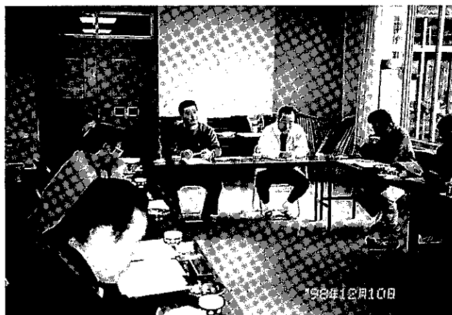
認定農業者座談会の様子（田島町）

現在南会津管内では、152名（法人4を含む）の認定農業者が活躍しており、さらなる拡大をめざしています。