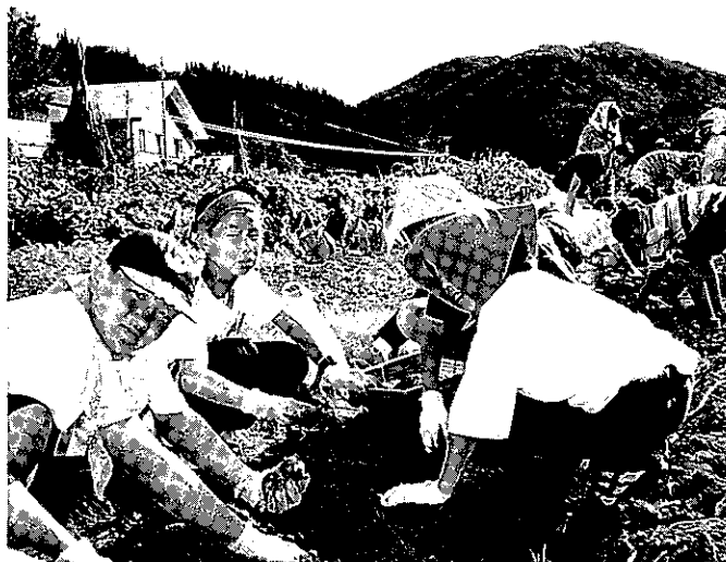
「森林の分校・ふざわ」で体験学習をする千葉県柏市児童スクールの皆さん

オープンして3年目、都市と集落の人との交流がどんどん増えている。まさしく過疎化の進む布沢集落の親戚づくりである。県内ではいわき市に次ぐ雄大な面積を有する『自然の宝庫只見町』の集落の活性化は21世紀に向けて限りなく広がっていくことだろう。