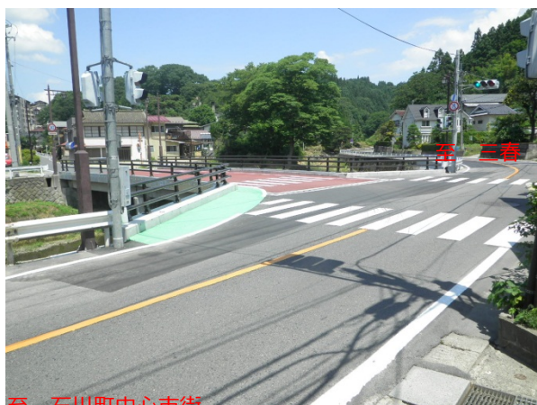
至 石川町中心市街