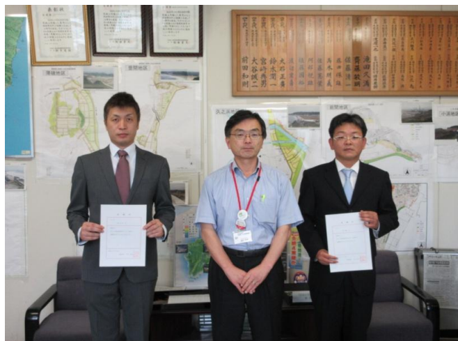
( いわき建設事務所長から委嘱状を手渡す様子 )

福島県では橋の周辺に住む住民の力を借り、定期的に橋梁の状況把握を行い、目視点検により変状を早期に発見し、報告してもらう橋梁点検サポーター(SBI: Supporters of Bridge Inspection)導入しています。そしてこの度、平成27年8月26日に今年度の点検サポーター2名の方へ委嘱状を交付しました。