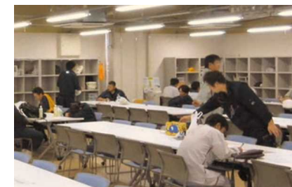
休憩・ミーティング風景