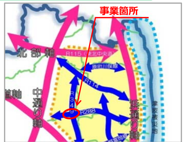
国道288号船引バイパス 全体計画 約7km

車道幅員 5.5m（道路幅員 9.0m）の現道に対し、 車道幅員 6.5m 歩道幅員 2.5m（道路幅員 11.0m）の バイパスを整備しています。