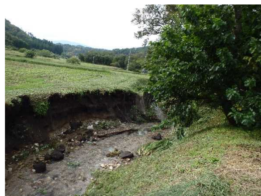
田村市都路町の農地災害

平成27年9月9日から11日にかけて関東地方・東北地方で発生した大雨は「平成27年9月関東・東北豪雨」と命名され、当管内でも田村市・天栄村で田畑や道水路に多くの被害が発生しました。11月24日（火）から27日（金）にかけて災害査定が始まります。来年の作付に支障が生じないように災害査定後、速やかに工事を進めていく計画となっております。