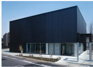
アルテマイスター保志