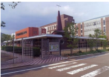
桜の聖母学院幼稚園園舎