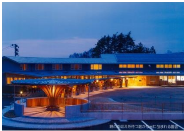
二本松市立とうわこども園