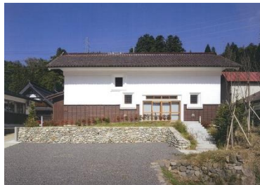
会津坂下町 気多宮 街なみ交流センター