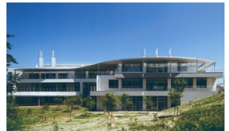
日本全薬工業株式会社 研修管理棟