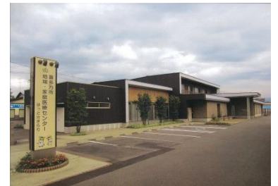
喜多方市 地域・家庭医療センター 「ほっと☆きらり」