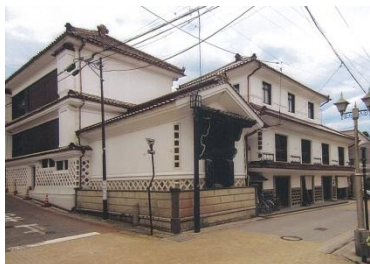
飯坂温泉「なかむらや旅館」