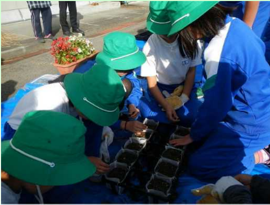
ポットへのドングリまき

平成30年「第69回全国植樹祭」が福島県南相馬市で開催されることが決定しました。