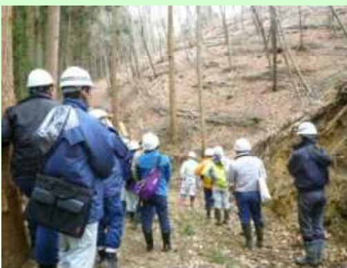
森林整備の現地研修

12月2日(水)、森林管理署、市町村、林業事業体等による第3回目となる労働力確保に向けた意見交換会を開催しました。