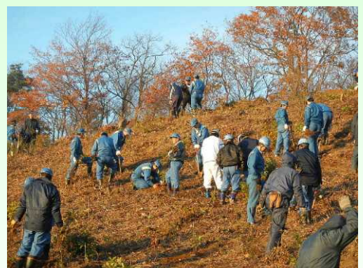
住友ゴム白河工場による森林整備活動

おり、今後、二酸化炭素吸収量の認証申請が行われる予定となっています。(森林林業部)