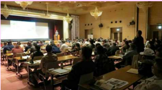
セミナー開催の様子

12月8日(火)、白河市においてブロッコリーの生産・流通の知識を高めるためブロッコリー生産振興セミナーを開催し、県南地方の生産者、JA職員や農業短期大学の学生ら約130名が参加しました。