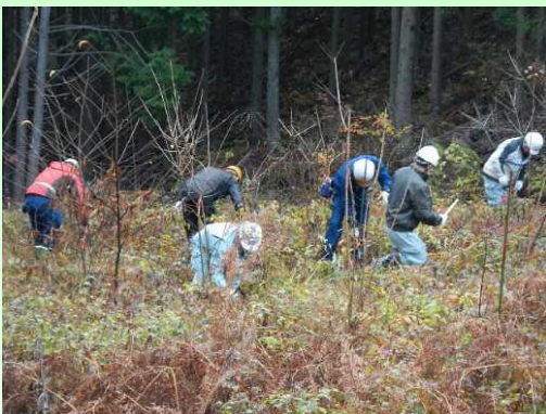
常磐興産(株)による森林整備活動

福島県では、平成21年度より県内の森林で社会貢献活動として企業や団体等が実施した植栽や下刈り、間伐などの森林整備活動の成果を二酸化炭素吸収量に換算し、認証する取組を行っています。