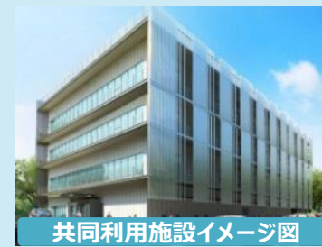
共同利用施設イメージ図