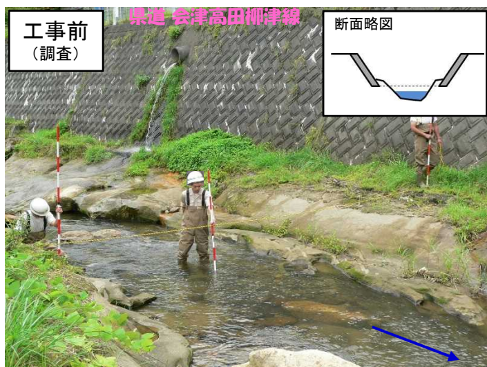
県道擁壁の基礎部より川底が低下している。(平成20年撮影)