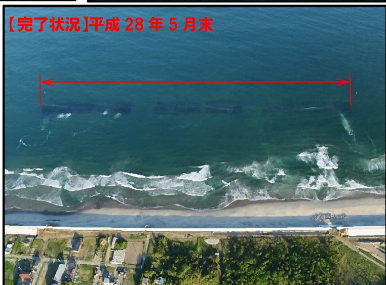
【完了状況】平成28年5月末