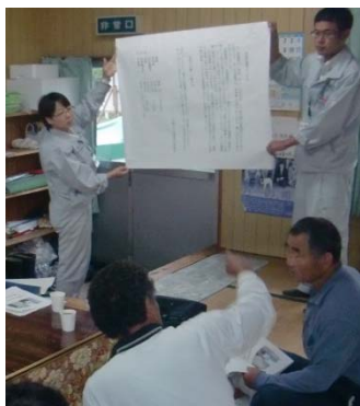
(実物大看板レイアウト案)

雨が降っていたため、現地に置いてみることは出来ませんでしたが、看板のサイズや文字の大きさなどについて、レイアウト案のとおり進めていきます。