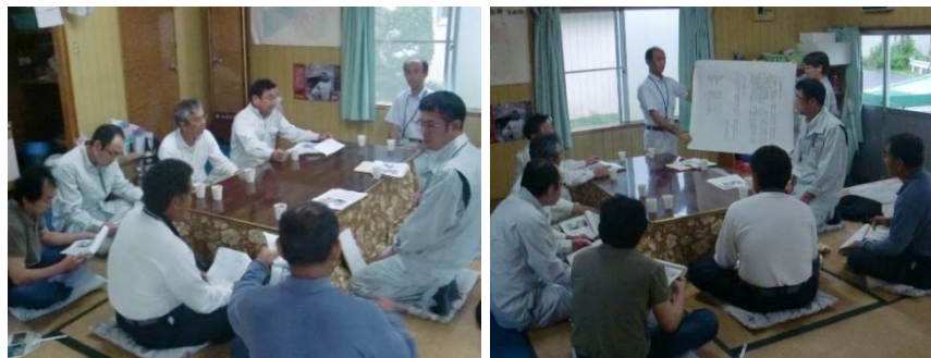
(地域づくり懇談会の様子)