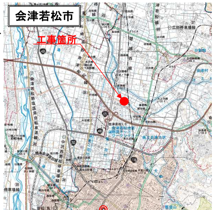
会津若松建設事務所