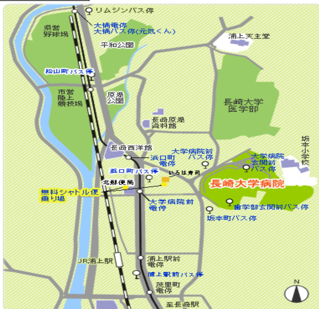
長崎大学病院周辺地図

本院正門付近に病院利用者用の立体駐車場があります。駐車料金は次のとおりとなっており、場内は係員の指示に従ってご利用ください。駐車場ゲートで駐車券を受け取り、 検査終了後に1階外来診療棟玄関ホール の駐車券割引受付コーナーで駐車券を提示し、駐車利用券の割引ライターによるチェックを受けてください。1日（1回）100円です。