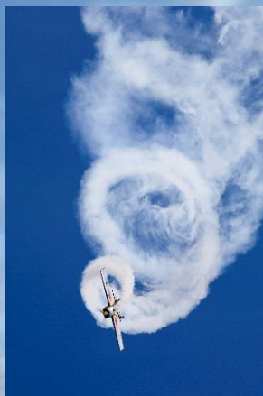
室屋 義秀 氏

福島市在住。パイロット。2009年にレッドブル・エアレース・ワールドチャンピオンシップにアジア人で初めて参加。2016年、千葉市美浜区幕張海浜公園で開催されたレッドブル・エアレース第3戦で日本人として初優勝を果たした。