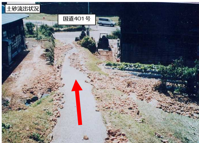
平成14年10月 台風21号豪雨 被害状況