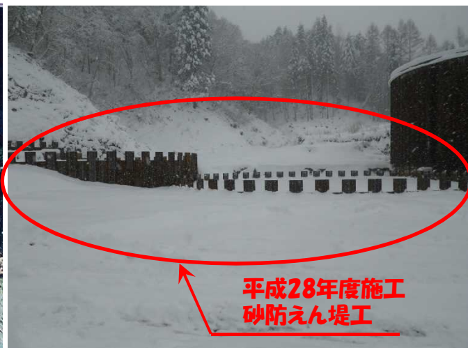
平成28年度施工 砂防えん堤工