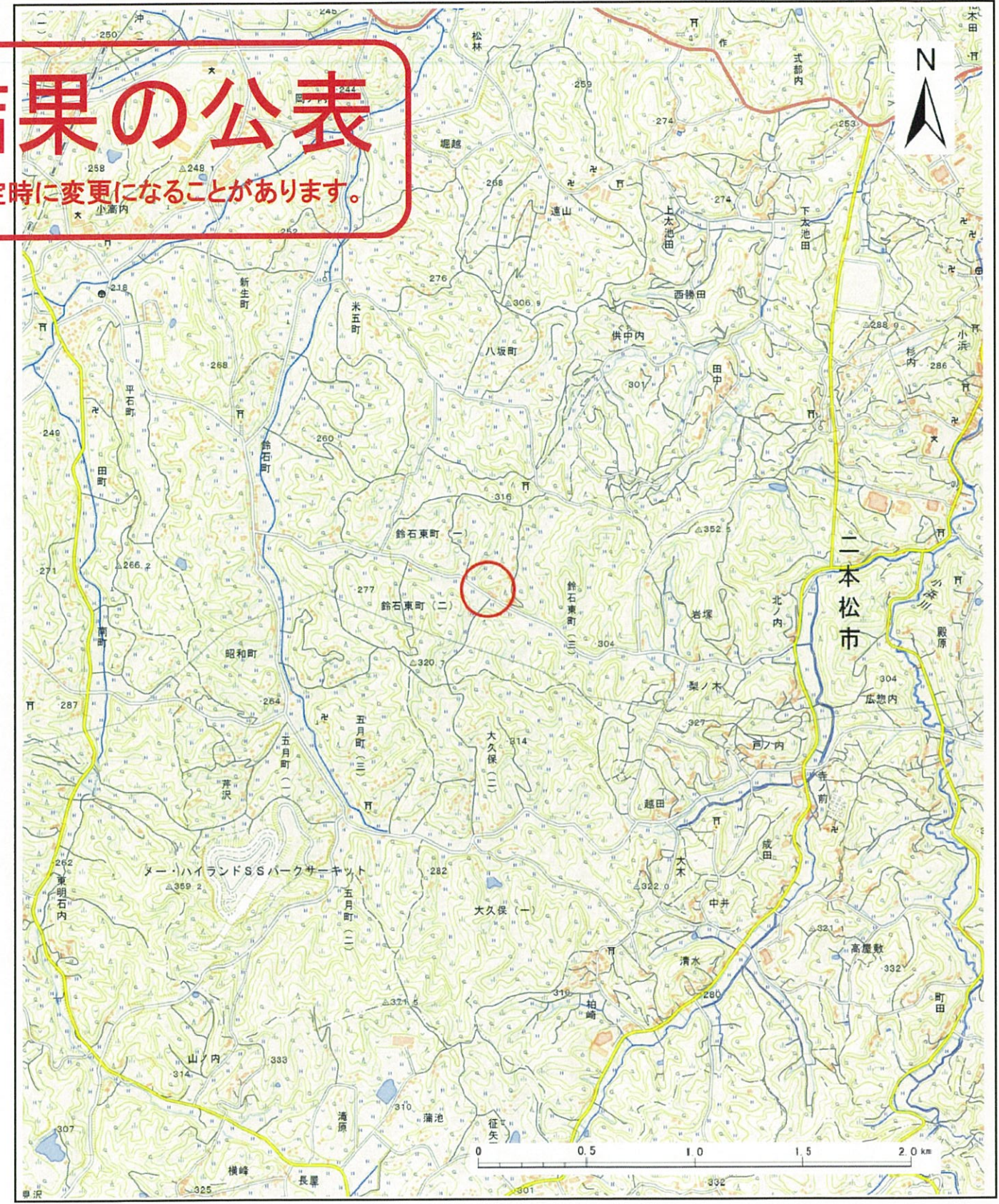
様式-1 (急) 土砂災害警戒区域・土砂災害特別警戒区域 位置図