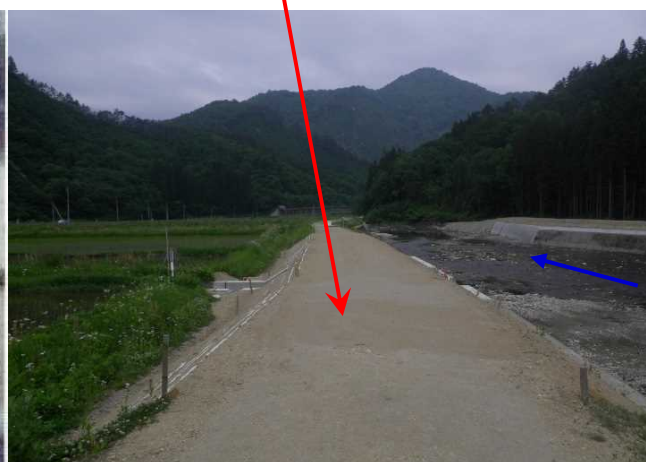
平成16年7月梅雨前線豪雨による国道400号冠水被害状況