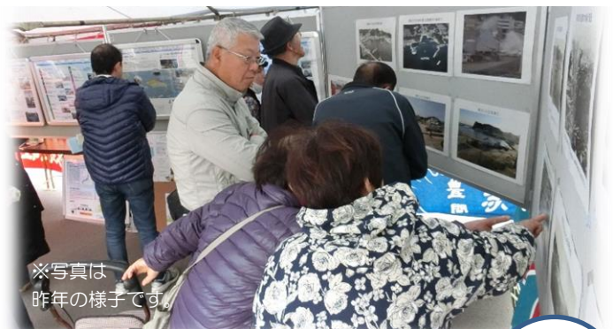
※写真は 昨年の様子です。

当事務所では、「港の PR ブース」を出展します。江名港の昔の風景や復旧・復興状況を写した写真を展示し、江名港の歴史について紹介します。