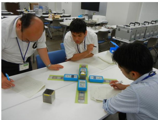
遮蔽効果を確認している様子