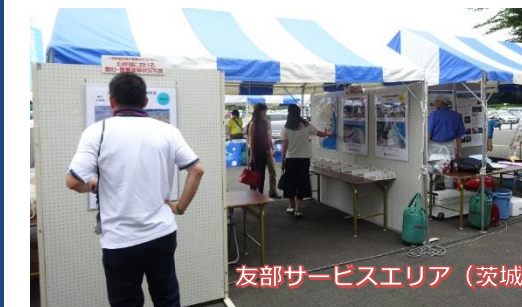
友部サービスエリア(茨城県)

いわき沿岸部は復旧・復興が進んでいます。 いわきの海は、安心して「来る」ことができることを多くの人に知ってもらうため、夏休みの期間に県内外各地でPR活動を実施しました。PR活動では、沿岸部の空撮写真を拡大したパネルを展示し、震災後と今が比較できるようにしています。空撮写真のほとんどは、職員がドローンで撮影したものです。 地元の高校生や福島の大学生に対しては、いわき沿岸部の復旧・復興状況を体感してもらい、いわきは「来る」ことができるということを各地で広めて欲しいと伝えました。 今後も、いわき沿岸部は安心して「来る」ことができることを広く伝えていきます。