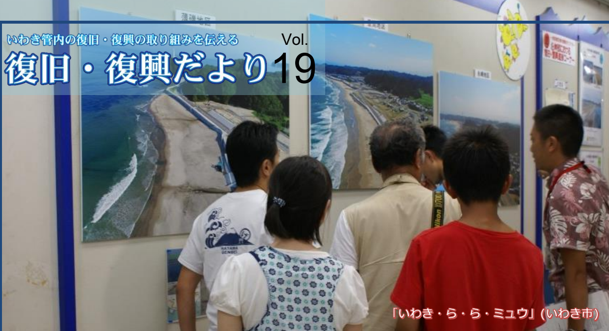
「いわき・ら・ら・ミュウ」(いわき市)

いわき沿岸部の復旧・復興が進んでいることを広く伝える「企画調査課」 みんなが安心していわきに「来る」ことができる