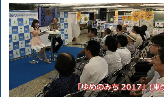
「ゆめのみち 2017」(東京都)