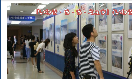
「いわき・ら・ら・ミュウ」(いわき市)