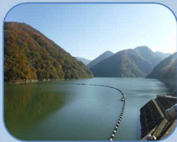
貯水池(会津美里湖)