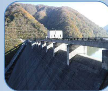
右岸から堤体を望む