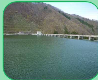
貯水池(会津美里湖)