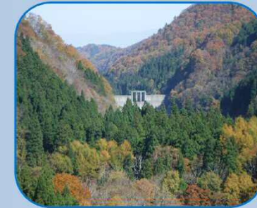
下流に位置する 宮川防災ダム