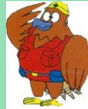
はかせくん (ダムマスコットキャラクター)