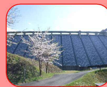
下流から上流側へ 堤体を望む

*監査廊とは、ダム堤体の挙動、漏水など異常の有無を点検するためにダム堤体内部に設置された管理用通路