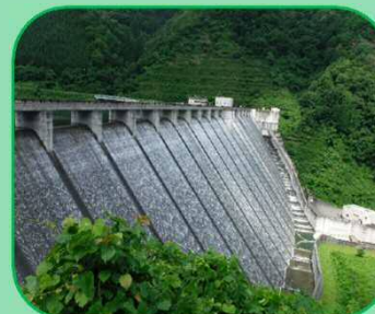
右岸から堤体を望む