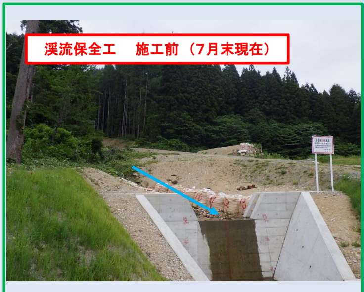
溪流保全工 施工前 (7月末現在)