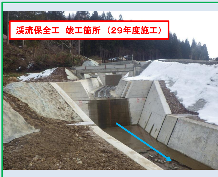
溪流保全工 竣工箇所 (29年度施工)