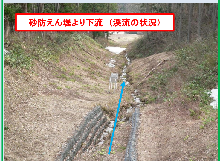
砂防えん堤より下流（溪流の状況）