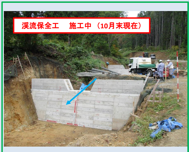
溪流保全工 施工中（10月末現在）