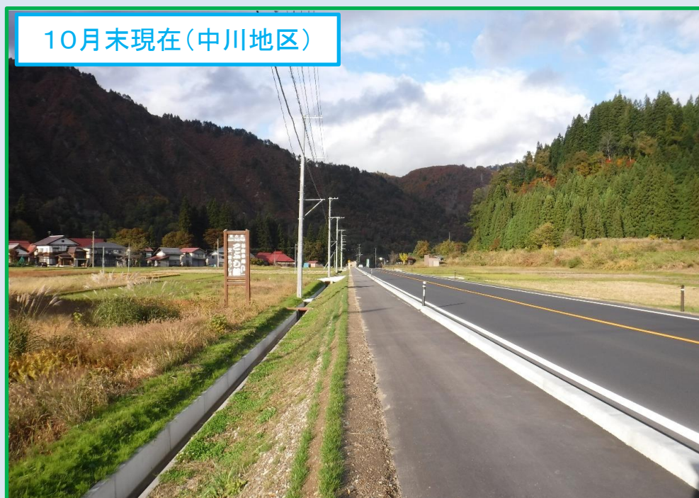
10月末現在(中川地区)

昨年度から実施してた舗装工事(中川地区)が完成しました。引き続き、残りの工区にも順次着手し、早期供用に向けて整備を進めております。国道252号水沼地区にも建設の槌音が鳴り響き活気が溢れる地域となります。