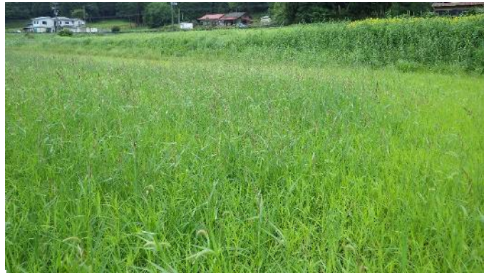
写真2 除染後農地の様子(8月28日) ほ場:飯館村二枚橋(2015年5月除染完了)