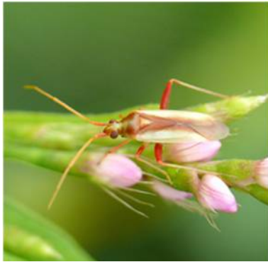
写真1 アカスジカスミカメ成虫