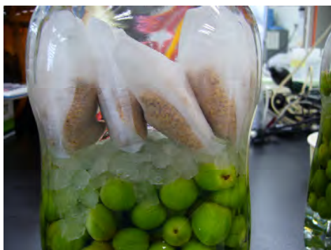
写真1 梅酒加工時の様子