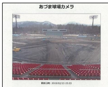
ライブカメラ映像