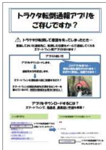
アプリ活用を呼びかけるチラシ

福島県では、農作業中の死亡事故を防ぐため、農業従事者に「トラクタ転倒通報アプリ」の利用を呼びかけています。このアプリは、トラクタが転倒した時に、あらかじめ設定した5件の連絡先に転倒した位置をメールで知らせてくれるものです。連絡先の設定とスマートフォンを運転席の前に設置するだけで、特別な機器は必要ありません。福島県の農業担い手課ホームページ ( https://www.pref.fukushima.lg.jp/sec/36021c/ ) から無料でダウンロードすることができます。