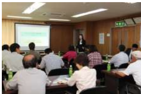
第1回講義(きゅうりコース)