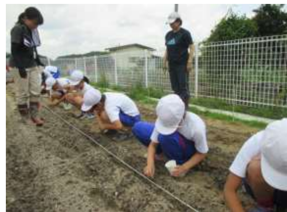
曲がらないようにそっと大豆の種をまく様子