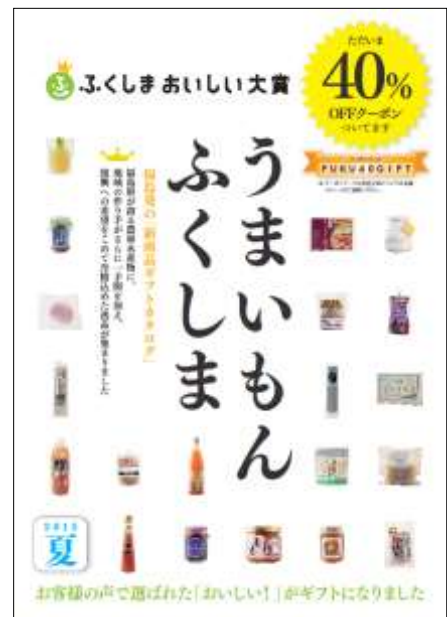
贈答用セット商品カタログ「うまいもんふくしま」の表紙 (※県北農林事務所、アンテナショップで入手可)