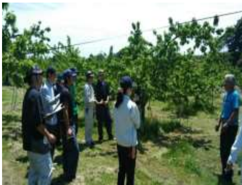
実習（摘果作業）の様子

に質問をして、疑問を解消していました。特に実習では作業の勘所をつかもうと、ベテラン農家の管理方法を観察し、反復している姿が印象的でした。