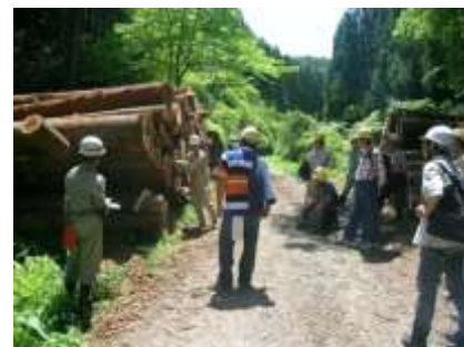
森林伐採現場見学会(南相馬市)

「ふくしまの木=地元材」を使うことにより、森林の手入れが進み、森林を守り育てることにつながり、輸送エネルギーの削減にもつながります。元気な森林は地球温暖化の主な原因である二酸化炭素を吸収し、地球環境にも貢献します。また、構成メンバーがネットワークを組むことにより、「地産地消」のシステムを構築して、大工技術・技能の継承と住宅の質の向上に努めています。グループとしての実施事業としては、一般の人も対象とした森林・木材市場・製材所等の見学会、技術研修会、住宅の現場・完成見学会を定期的に行い、ふくしま住宅フェア、林業際等のイベントにも積極的に参加し、地元材利用の普及・PR活動を行っています。