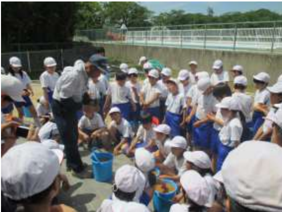
バケツ稲の作り方を熱心に聞く児童たち

5月22日（金）に行われた「バケツ稲づくり」では、始めにJAみちのく安達の職員からバケツ稲の作り方の説明を受けました。