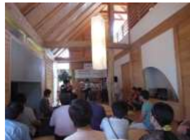
展示住宅「きなり」コンサート

(2)平成24年度から平成26年度まで3年連続、国土交通省による「地域型住宅ブランド化事業」の採択グループとなり、地域材を活用した木造長期優良住宅を供給しています。また、今年度から始まった「地域型住宅グリーン化事業」にも応募し、省エネルギー性や耐久性に優れた木造住宅・建築物の供給を目指しています。