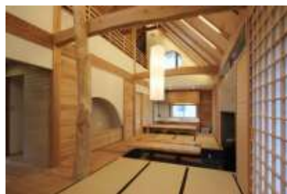
展示住宅「きなり」内部