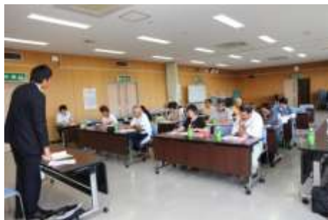
第1回講義(ももコース)