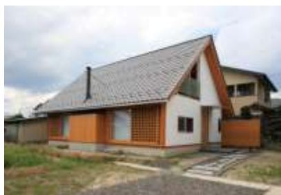
展示住宅「きなり」外観

また、展示場では各種イベント(きなりコンサート、講演会、料理教室、青空木工教室など)を開催し、気軽に展示住宅を見学してもらおう機会としています。