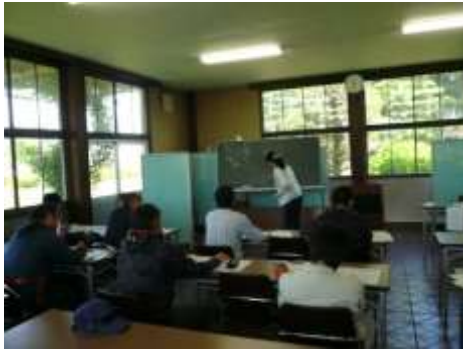
果樹の基本用語についての講義

第 1 回（5 月 22 日）の開講式では J A 新ふくしまと当事務所から歓迎の挨拶を行った後、当事務所の新