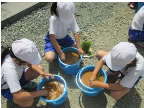
コシヒカリの苗を植える様子

初めて水稻の苗にさわると児童がほとんどでしたが、地区の生産者や当農林事務所安達農業普及所の職員にいろいろと質問をしながら、バケツに土や肥料を混ぜ、水を入れてコシヒカリの苗を植えました。