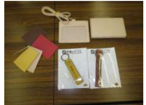
試作販売中のストラップほか

伊達市農林業振興公社では、有害獣として捕獲したイノシシの皮を活用して、ネームホルダーや名刺入れ等を製作し、製品化・販売を目指す「猪革プロジェクト」を進めています。