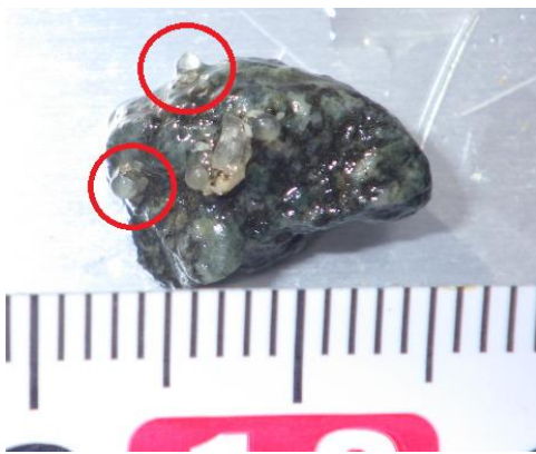
図2 アユ産着卵(木戸ダム上流、2018年10月16日)