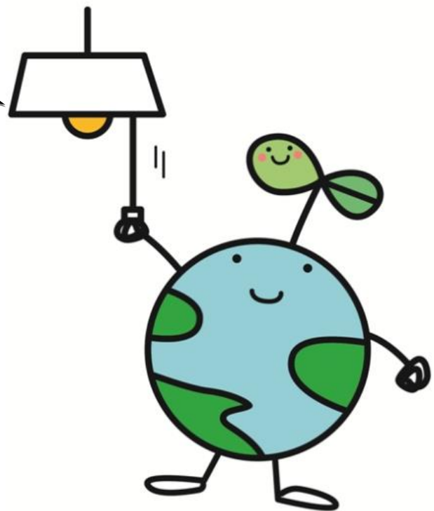
福島県の地球環境保全のキャラクター 「エコたん」