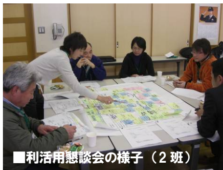
■利活用懇談会の様子（2班）