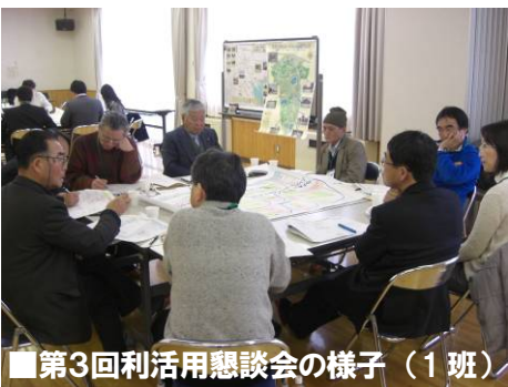
■第3回利活用懇談会の様子（1班）