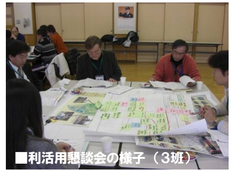
■利活用懇談会の様子（3班）