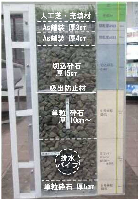
グラウンド断面図