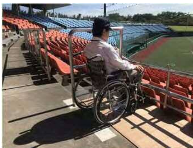
増設された車椅子用観覧席