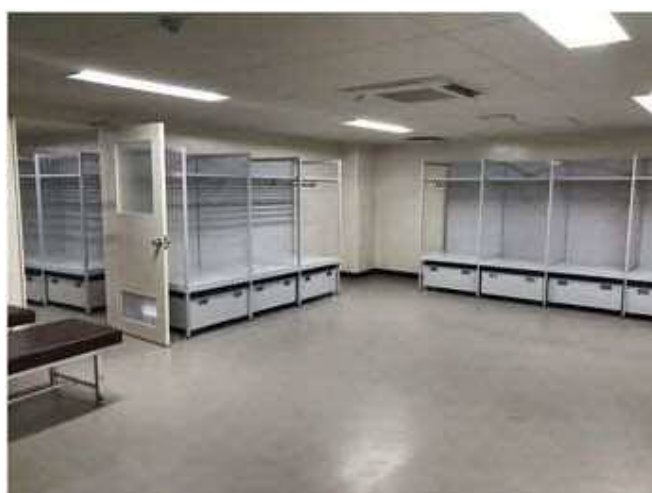
広々とした選手更衣室