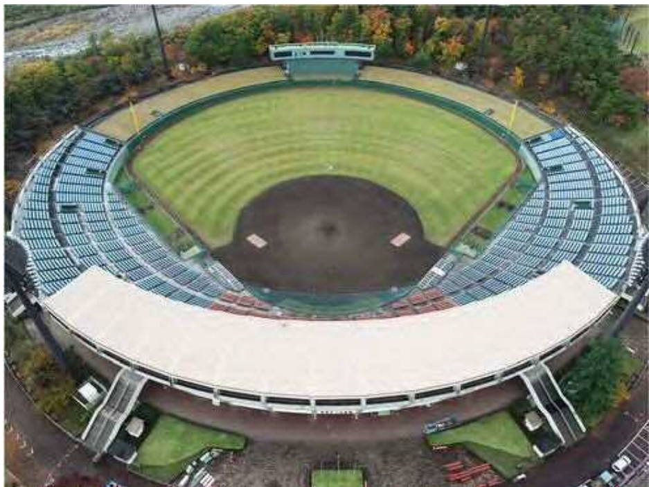
①工事着手前の様子

県営あづま球場の内野は黒土、外野は天然芝で覆われていましたが、雨が降ってもすぐ乾いて試合ができるよう、グラウンドの全面を人工芝に改修する工事が行われました。敷設された人工芝は大手スポーツメーカーが開発したもので、西武ライオンズのメットライフドームなどプロ野球の各球団本拠地でも採用されています。天然芝のグラウンドに比べ排水性、クッション性の向上が期待され金属スパイクを履いての利用も可能です。