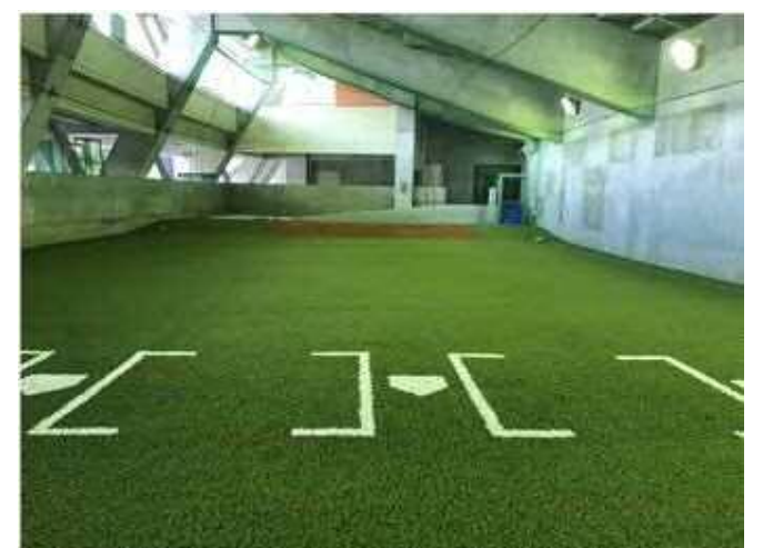
人工芝が敷設された屋内練習場