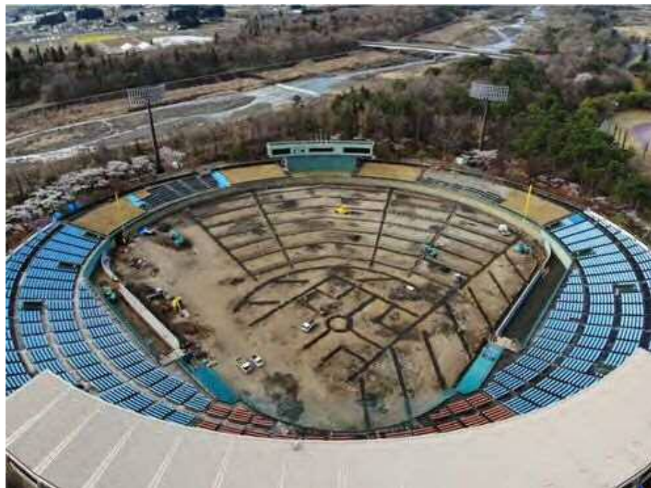
②排水パイプ埋設の様子