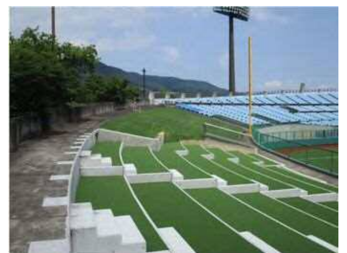
利用しやすくなった外野席