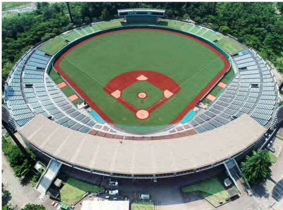
⑤人工芝、充填材敷き込み後の様子