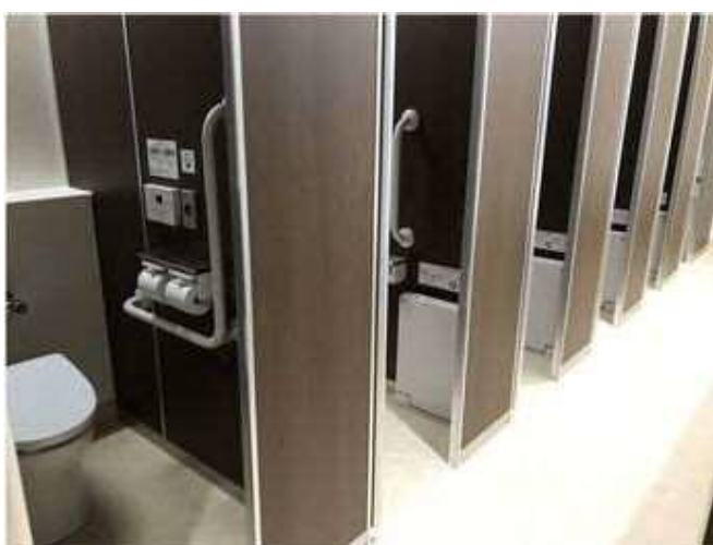
球場内すべて洋式化されたトイレ

オリンピックの開催会場に選ばれたことから、県営あづま球場では昨年11月から様々な改修工事が進められています。これまで、グラウンドの人工芝化の他、外野フェンスの改修、選手更衣室の改修、トイレの洋式化、車椅子用昇降設備の設置等が行われました。