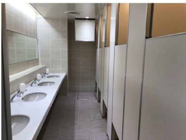
きれいで清潔な選手シャワー室