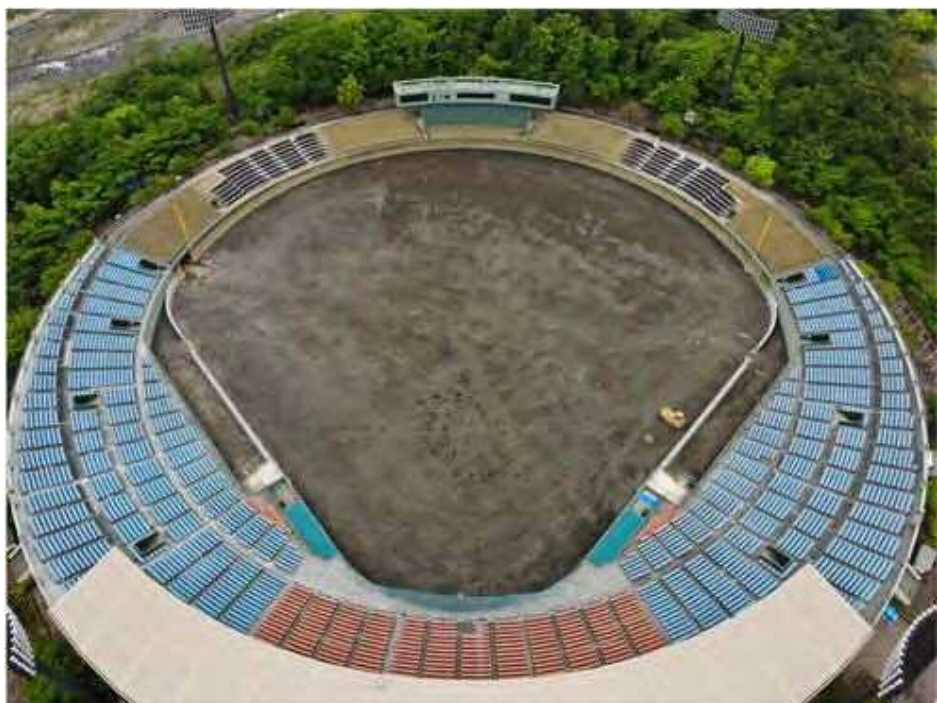
③切込碎石を敷き均した後の様子