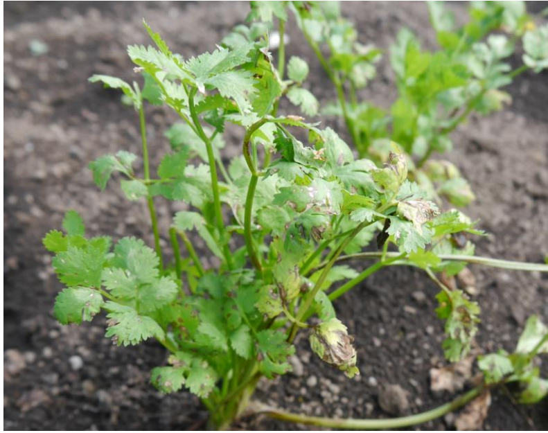
写真1：罹病株の様子