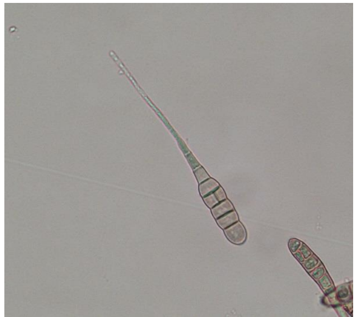
写真4：病原菌の分生子