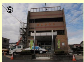
⑤ 路線名：櫛倉警察署 事業名：櫛倉警察署耐震改修・大規模改修工事 場所：東白川郡櫛倉町大字流地内 工事説明：庁舎の外壁補修や内部設備機器更新とともに耐震改修を行い、安全で良好な行政庁舎の提供を図ります。