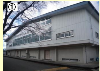
① 路線名：白河実業高校 事業名：白河実業高校災害復旧工事 場所：白河市瀬戸原地内 工事説明：地震で被災した実習室や体育館の外壁・屋根の補修とともに耐震補強を行い、安全で良好な教育環境の提供を図ります。