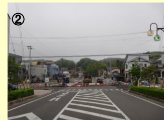
② 路線名：(都)白河駅白坂線 事業名：街路事業 場所：白河市大町地内 工事説明：「白河の顔となるシンボルロード」を形成する道路として、安全安心な歩行空間を確保することで、地域の歴史を生かしたまちなか観光を確立しながら、中心市街地の活性化に寄与します。