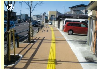
路線名：白河羽鳥線 事業名：やさしい道づくり推進事業 場所：白河市道場小路地内 工事説明：快適な歩行空間づくりを進めるため、歩道の段差解消および視覚障がい者用ブロックや透水性舗装の整備を進めています。