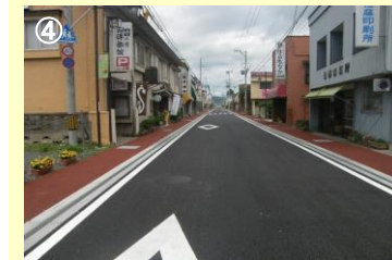
路線名：壱大津港線 事業名：交付金事業 場所：東白川郡塙町大字塙地内 工事説明：快適な道路空間づくりを進めるため、歩道の段差解消および歩道内の電柱移転を進めています。