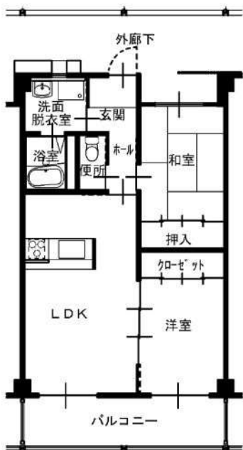
2LDK 一般仕様 (201, 206, 301, 306)