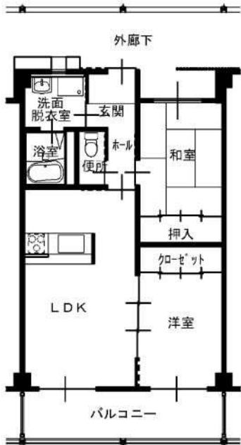
2LDK 高齢者仕様 (101, 106)