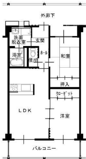
2LDK 高齢者仕様 (105)