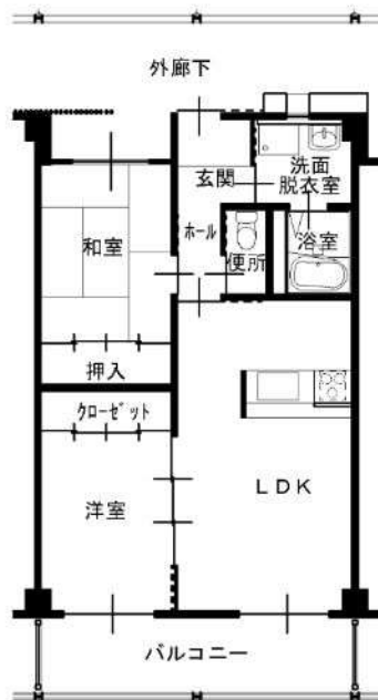
2LDK 高齢者仕様 (104)