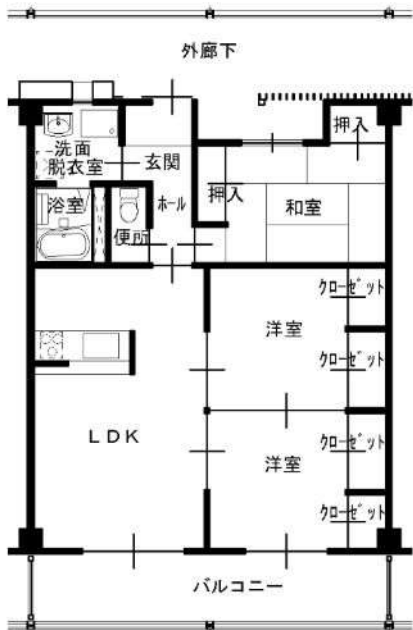
3LDK 高齢者仕様 (101, 103, 107)