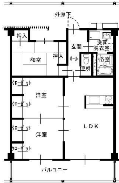
3LDK 一般仕様 (202, 206, 208, 302, 306, 308)