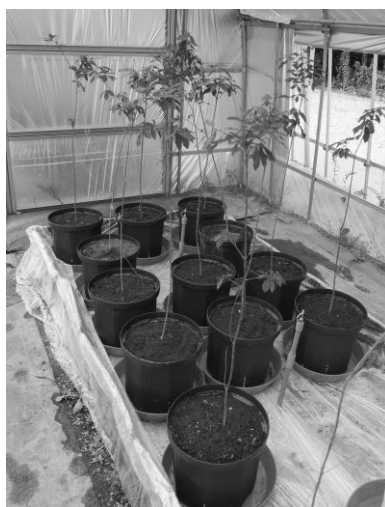
図2 ポット試験の様子