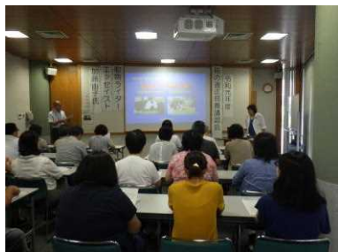
講習会の様子(南相馬会場)