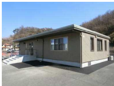
譲渡会や講習会を行う 会議室