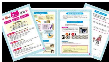
作成した普及啓発リーフレット