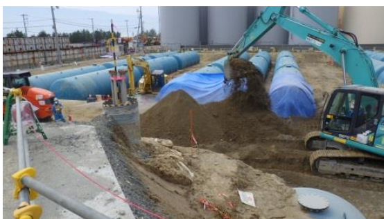
(写真3) G 1 タンクエリア南側