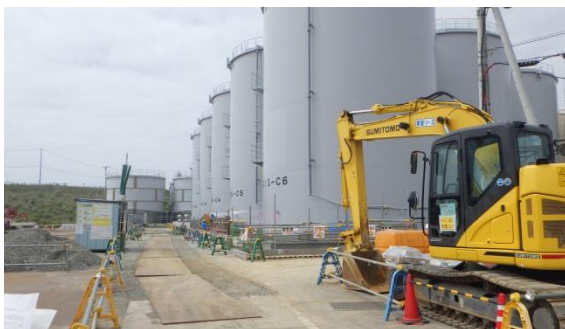
(写真4) 中央の手前側3基が新たに設置されていたタンク