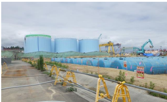
(写真1) G1タンクエリア北側