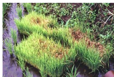
写真. 置き苗から発生したいもち病

会津地方における葉いもちの初発は6月下旬頃です。補植用の置苗は、いもち病の発生源になるので早急に処分しましょう。