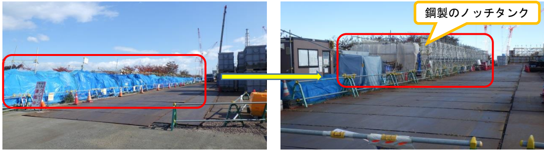
(写真 2 - 1) 前回撮影