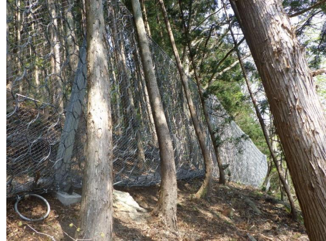
下郷町小沼崎地内