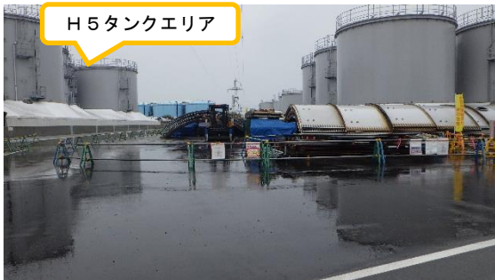
(写真3-2) H5タンクエリア東側の一時保管場所 の状況 (南側から撮影)