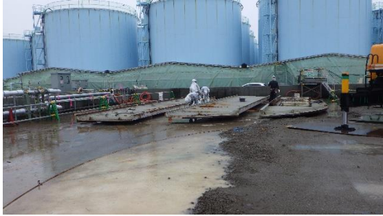
(写真2) 作業員の作業状況 (現場の整理作業を実施)