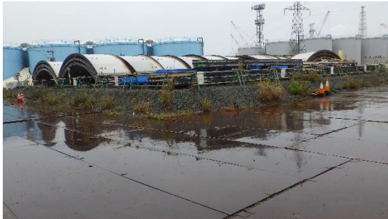
(写真3-1) H5タンクエリア北側の一時保管場所 の状況 (南側から撮影)