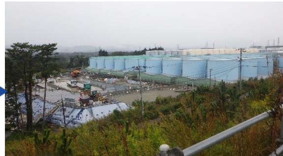
（写真1－2） 同左 （令和2年10月8日撮影）