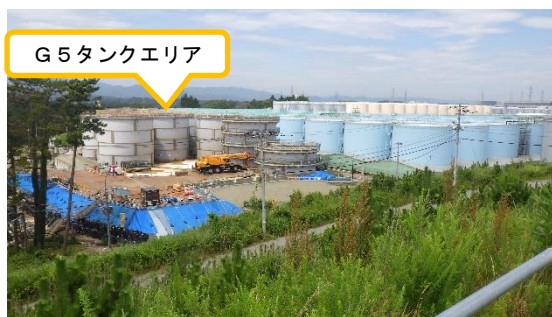
（写真1－1） G5タンクエリア（東側から撮影） （令和2年8月17日撮影）