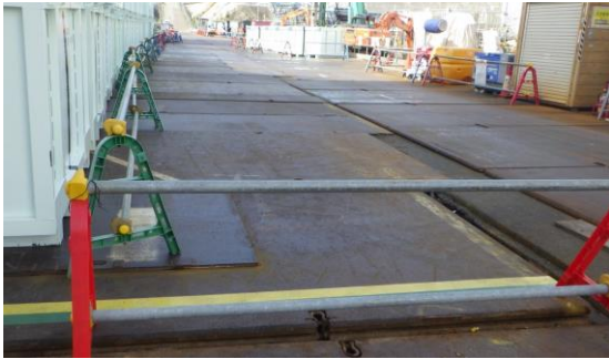
(写真1-2) 2、3号機間原子炉建屋間道路 西側の状況