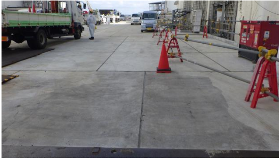
(写真1-1) 2、3号機間原子炉建屋間道路 東側の状況