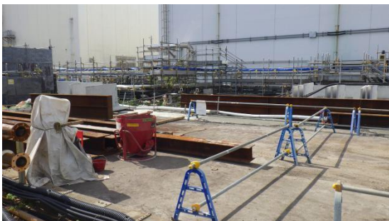
(写真2-3) 2号機タービン建屋東側の状況3