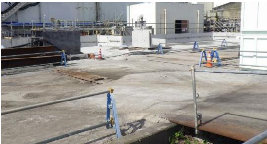
(写真2-2) 2号機タービン建屋東側の状況2