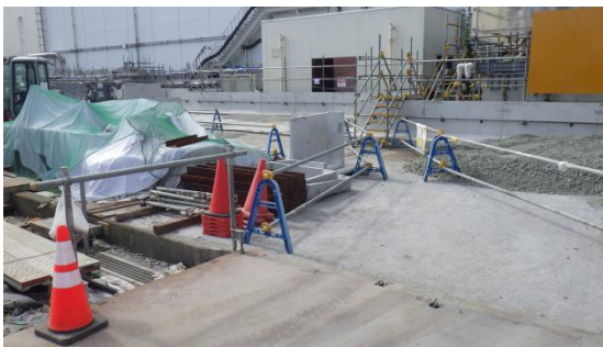
(写真2-1) 2号機タービン建屋東側の状況1