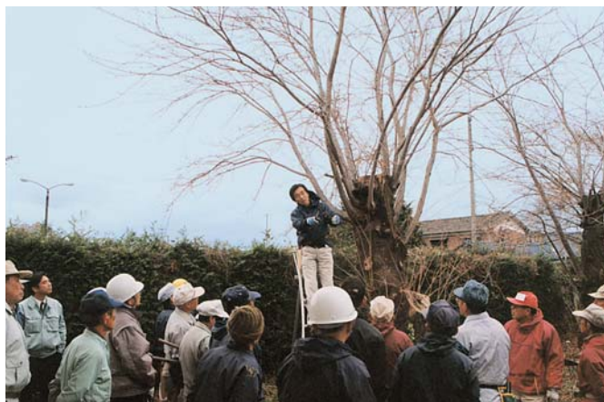
緑化技術研修会（原町市）