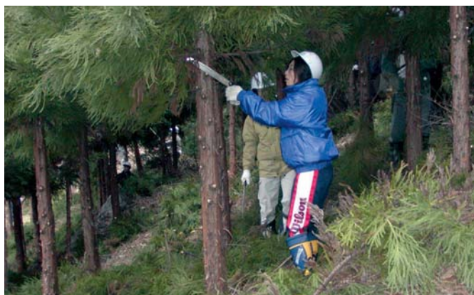
枝打ちボランティア（原町市）