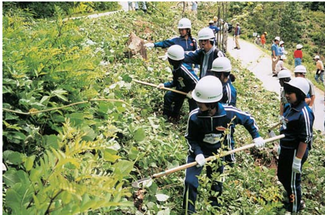
未来博会場での体験交流会（須賀川市）

このため、「県民の森」をはじめとする森林とのふれあいの場の整備拡充や普及啓発活動に努めるとともに、県民参加による緑化活動と森林づくり運動の支援拡充を図ります。