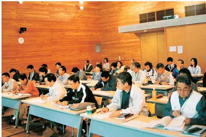
もりの案内人養成講座（大玉村・県民の森）