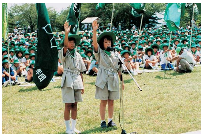
緑の少年団大会（大玉村・県民の森）

樹木を手入れする育樹活動を通じて、森林・林業に対する理解の促進や森林に対する愛情を培うことを目的に開催されるイベント。