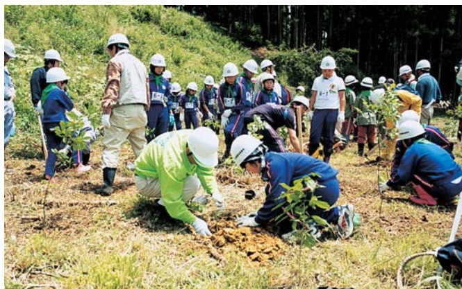
未来博会場での体験交流会（須賀川市）