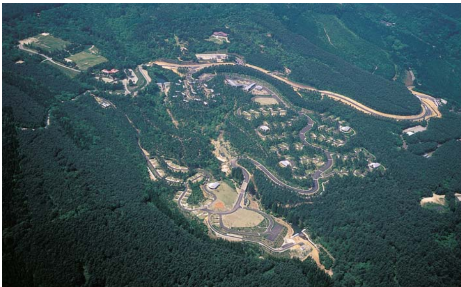
ふくしま県民の森「フォレストパークあだたら」オートキャンプ場の全景（大玉村）