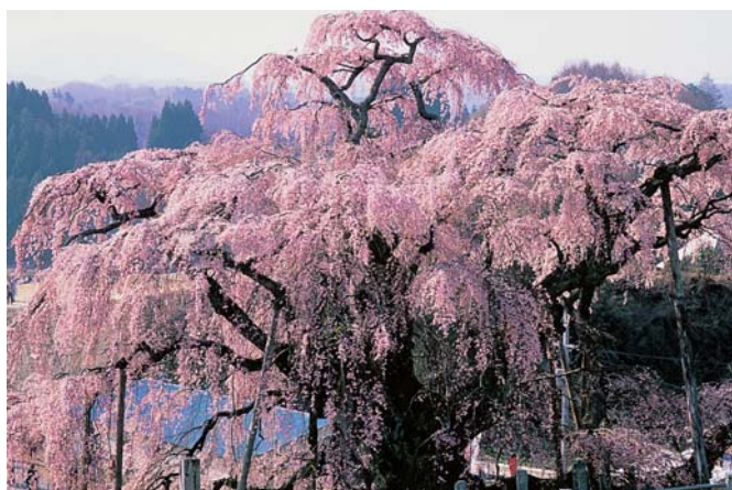
緑の文化財「滝桜」（三春町）