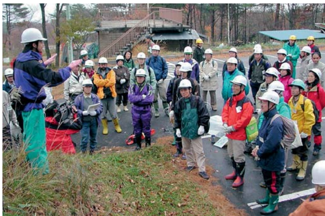
ワークショップ2001（大玉村・県民の森）