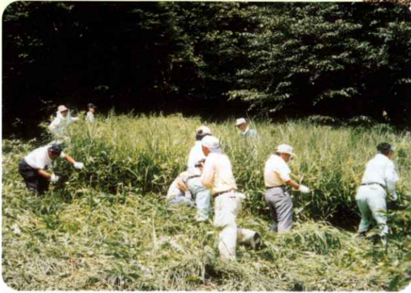
▲21世紀ロータリーの森 下草刈活動 (西郷村)