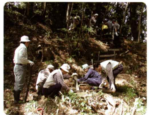
▲きのこオーナー交流会 (会津高田町)