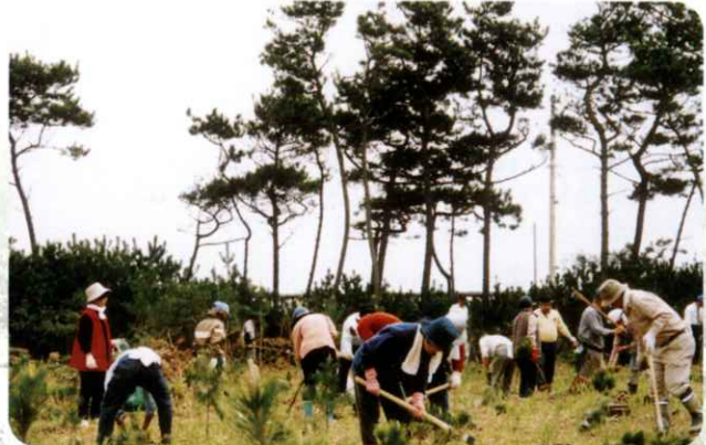
▲新舞子ふれあいの森 植林活動 (いわき市)