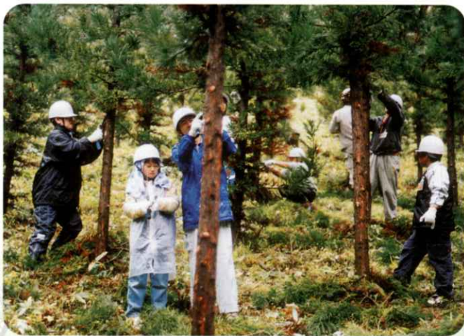
▲親子ふれあい森林整備活動 (船引町)