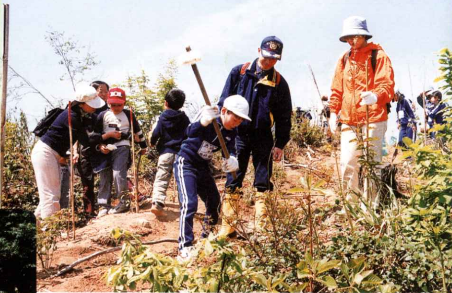
▲どんぐりの森づくり植樹祭 (梁川町)

うつくしま もり 21森林づくりネットワーク 及び県内7つの地域の地方推進組織が 中心となり、森林ボランティアによる 森林 もり づくり活動を各地で実施しています。