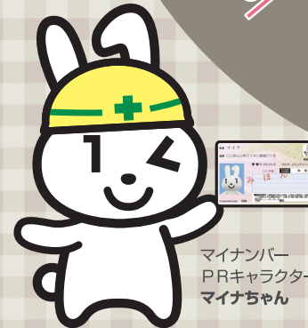
マイナンバーPRキャラクター マイナンちゃん